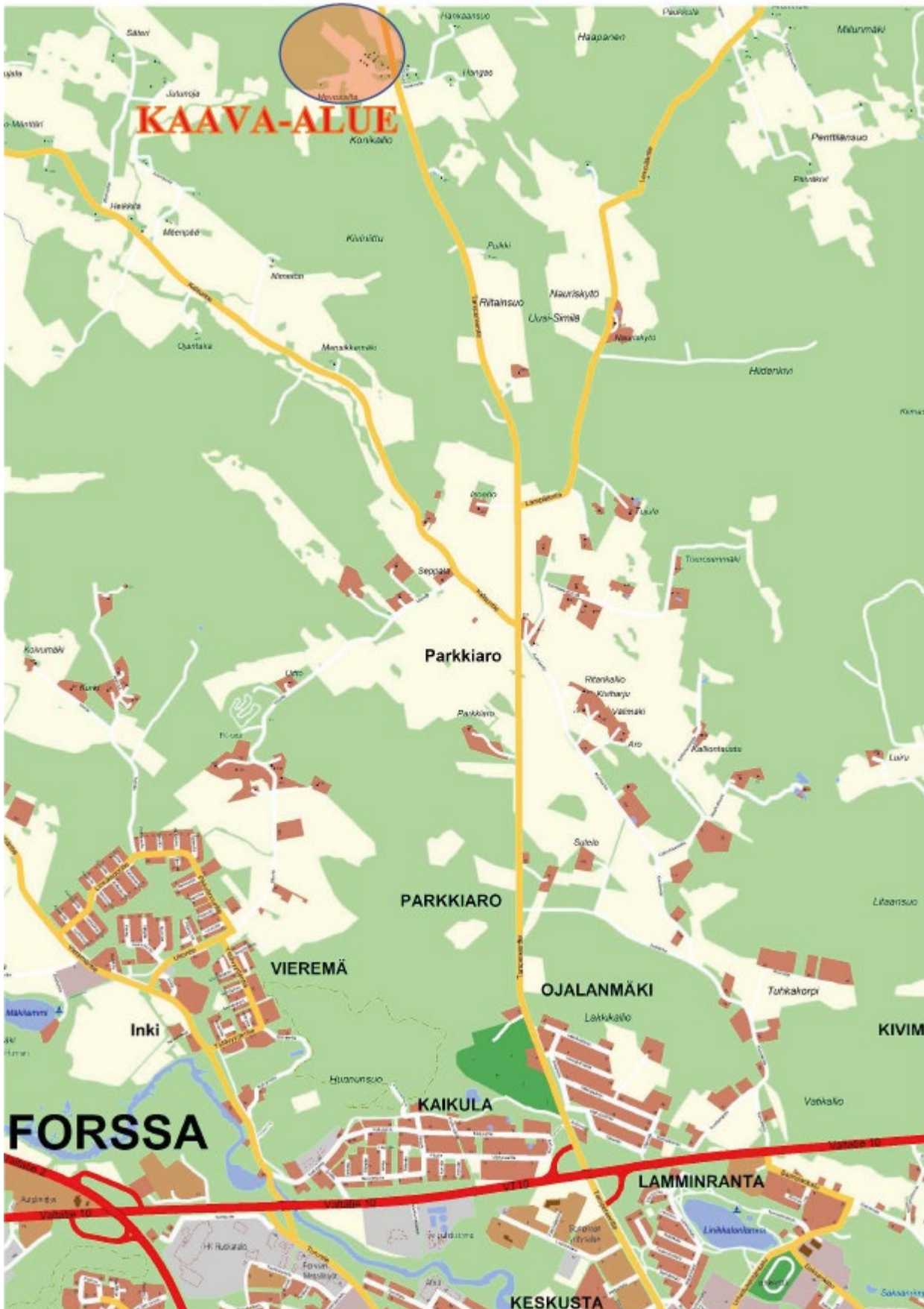
ALUEEN SIJAINTI TAMPEREENTIEN VARRELLA