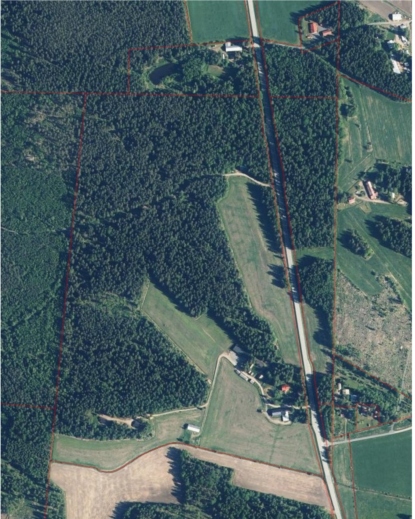
ALUEEN ORTOKUVA, © MML, kunnat